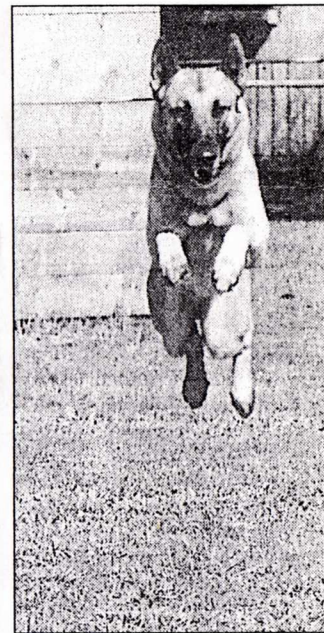
Au saut, le fossé n'est pas infranchissable. Un saut de 4,50 m pour J.K. (Photos Gilbert.)