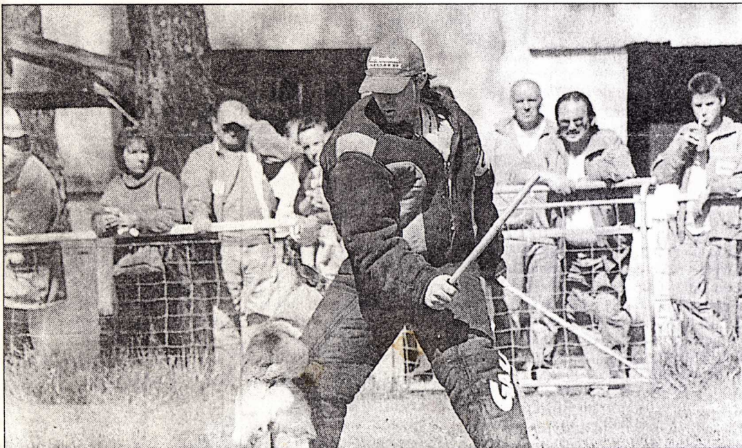
Qu'elles soient vraies ou fausses, les attaques de face sont toujours très spectaculaires.